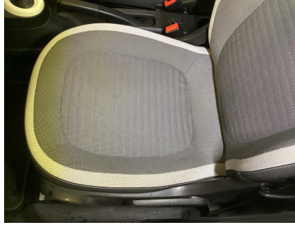
ETAT INTÉRIEUR - INTÉRIEUR AVANT Housse d'assise de siège AVG; Souillé; Léger