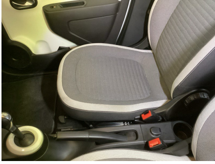
ETAT INTÉRIEUR - INTÉRIEUR AVANT Housse d'assise de siège AVD; Souillé; Léger