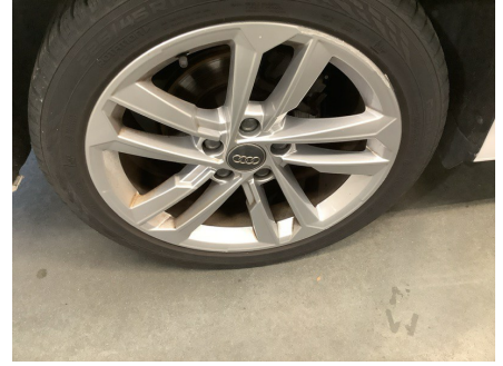
ETAT EXTÉRIEUR - CÔTÉ PASSAGER Jante ARD; Rayé; > à 50mm