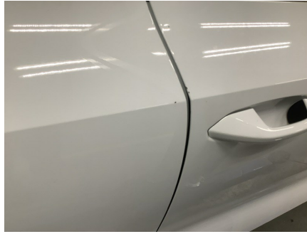
ETAT EXTÉRIEUR - CÔTÉ PASSAGER Porte AVD; Impact; Bord éraflé