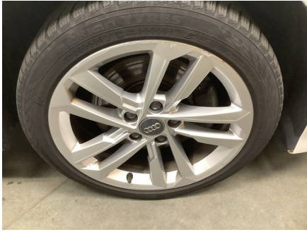
ETAT EXTÉRIEUR - CÔTÉ PASSAGER Jante AVD; Rayé; > à 50mm