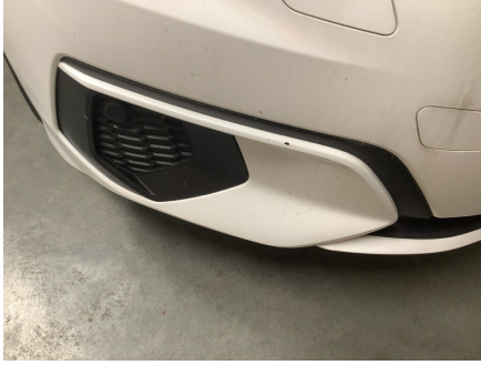
ETAT EXTÉRIEUR - AVANT Pare-choc AV; Impact; Impacts multiples