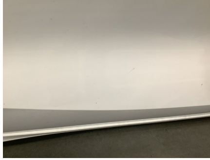
ETAT EXTÉRIEUR - CÔTÉ PASSAGER Porte ARD; Rayé; > à 25mm peinture d'origine