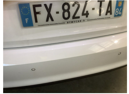
ETAT EXTÉRIEUR - ARRIÈRE Pare-choc AR; Rayé; > à 100mm peinture d'origine