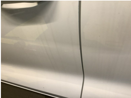
ETAT EXTÉRIEUR - CÔTÉ CONDUCTEUR Porte AVG; Impact; Bord éraflé